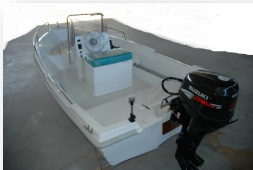
La popa de gran anchura, permite instalar motores de hasta 40 CV.