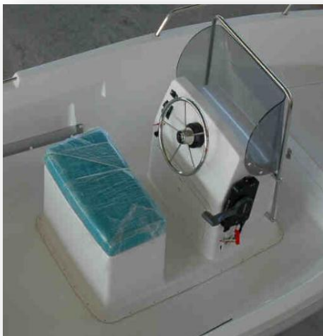
Consola con asiento tapizado, bajo él se encuentra una nevera de hielo.